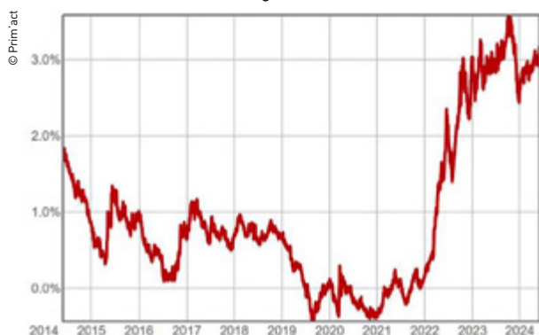
Barème de capitalisation – Figure 1 - Évolution des taux OAT 2014-2024 (agence France Trésor)

Il reste alors à fixer le niveau de ce taux d'actualisation, en tenant compte :